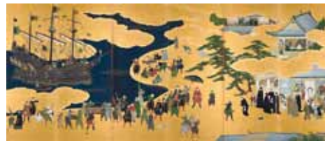
重文 南蛮屏風 狩野内膳筆 六曲一双(右隻) 神戸市立博物館所蔵