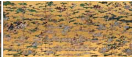
国宝 洛中洛外図屏風 狩野永徳筆 六曲一双(右隻) 米沢市上杉博物館所蔵