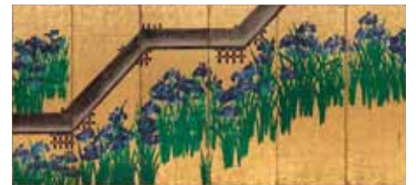
八橋図屏風 尾形光琳筆 六曲一双(右隻) メトロポリタン美術館所蔵 注1