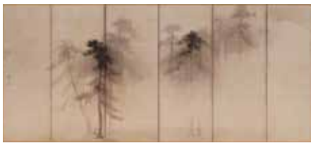
国宝 松林図屏風 長谷川等伯筆 六曲一双(左隻) 東京国立博物館所蔵