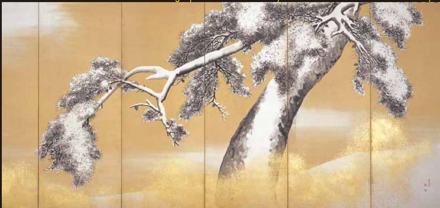
【文化財デジタル複製品】国宝 雪松図屏風 円山応挙筆 六曲一双(原本：三井記念美術館)