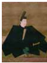
国宝 神護寺三像 佐藤原隆信筆 掛軸三幅 高雄山神護寺所蔵