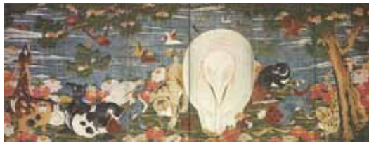
樹花鳥獸図屏風 伊藤若冲筆 六曲一双(右隻) 静岡県立美術館所蔵