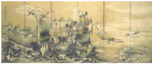
重文 楼閣山水図屏風 曾我蕭白筆 六曲一双(左隻) 近江神宮所蔵