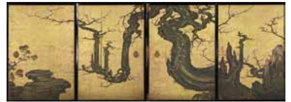
老梅図襖 狩野山雪筆 襖四面 メトロポリタン美術館所蔵 注2

※展示作品はすべて複製品となります ※上記記載は原本所蔵先です。複製品所蔵先とは異なる場合があります