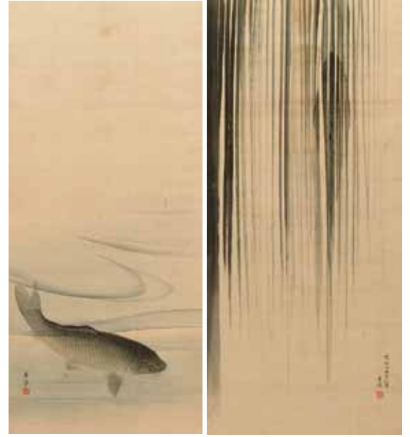
龍門鯉魚図 円山応挙筆 掛軸二幅 大乗寺所蔵

応挙と同じ江戸時代後期に活躍した 伊藤若冲 、 曾我蕭白 のほか、 狩野派 や 琳派 などの文化財複製品18点を一堂に展示します。いずれも、国宝や重要文化財に指定された作品、海外の美術館所蔵の作品など、日ごろ容易に見ることのできない作品を身近に鑑賞できる絶好の機会です。