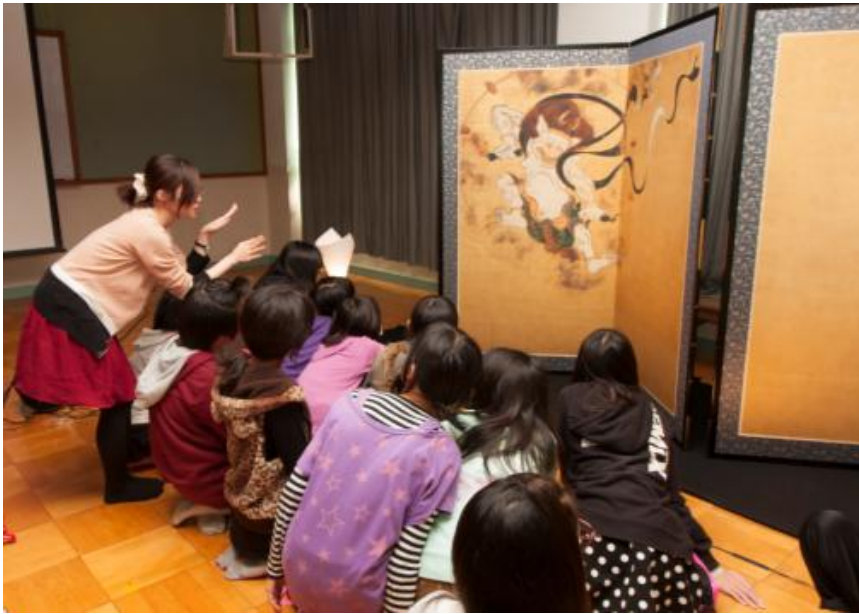
美豆小学校での訪問授業

平成28年5月から「文化財ソムリエ」として活動していただける 大学生・院生を募集します